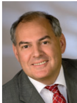
Klaus Tscheuschner Oberbürgermeister